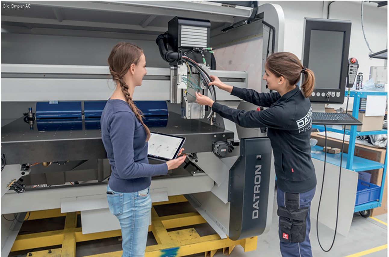
Erhebung eines Wertstroms bei Datron